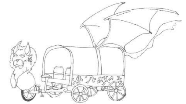
Croquis du char de la déambulation

Arrivée sur un lieu fixe avec farandole de performances. La troupe repart en défilé final.