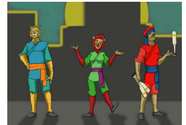
Dessin des costumes souhaités pour les personnages